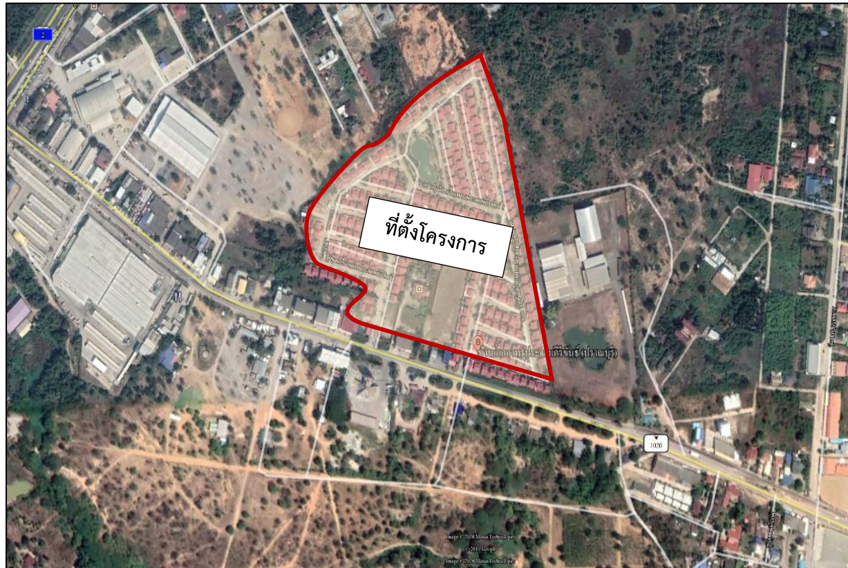
รูปที่ 1.2-1 ที่ตั้งของโครงการ